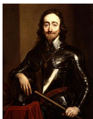
Charles I er (1494-1547)

Roi d'Angleterre, d'Irlande et d'Écosse de 1625 à 1649, auquel le Parlement s'oppose parce qu'il veut augmenter ses revenus et parce qu'il interfère dans les affaires religieuses de l'Église anglicane. Il est alors perçu comme un tyran. Il est vaincu lors des deux guerres civiles et est jugé et exécuté pour haute trahison en 1649.