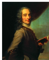
François Marie Arouet (Voltaire) (1572-1610)

Roi d'Angleterre, d'Irlande et d'Écosse de 1625 à 1649, auquel le Parlement s'oppose parce qu'il veut augmenter ses revenus et parce qu'il interfère dans les affaires religieuses de l'Église anglicane. Il est alors perçu comme un tyran. Il est vaincu lors des deux guerres civiles et est jugé et exécuté pour haute trahison en 1649.