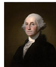
George Washington (1638-1715)

Philosophe et écrivain français, il est le principal représentant du mouvement des Lumières en France. Son influence est décisive sur la bourgeoisie avant la Révolution française. Il est opposé au fanatisme religieux de son époque et est partisan d'une monarchie modérée et libérale, sur le modèle anglais.