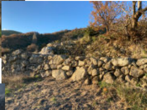
Le chemin du col de la Croix