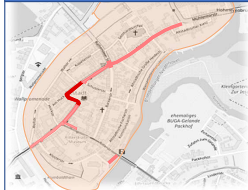
6. Bauabschnitt : ab 09.2025 Altstädtischer Markt