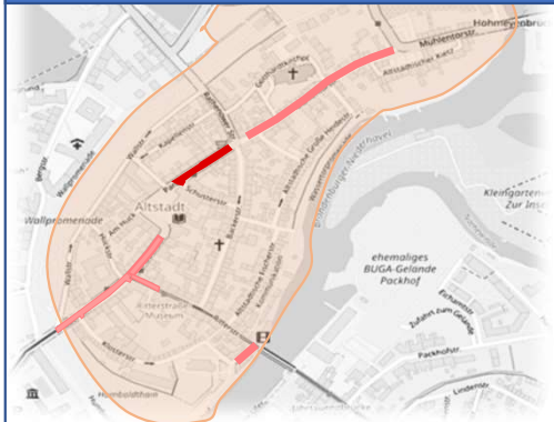
4. Bauabschnitt : 08.2024 – 01.2025 Parduin