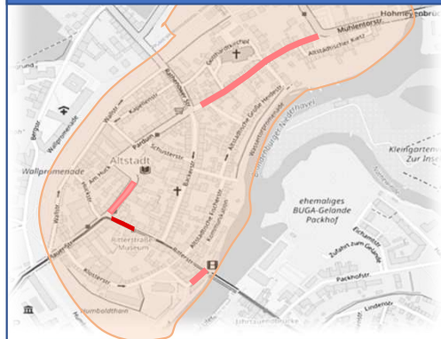
2. Bauabschnitt: 03.2023 – 07.2023 Ritterstraße: Teilfläche im Rahmen des barrierefreien Umbaus StrB-Haltestelle