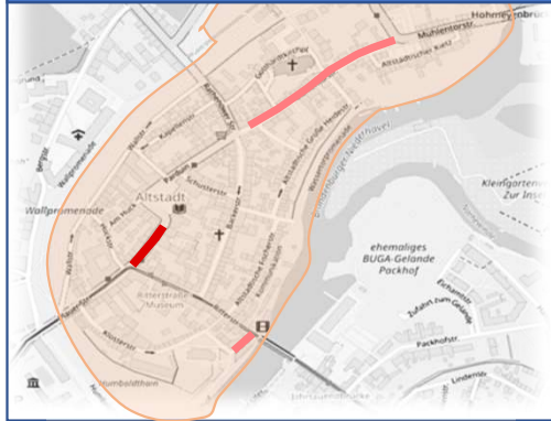
1. Bauabschnitt: 08.2022 – 02.2023 Plauer Straße: Altst. Markt – Ritterstr.