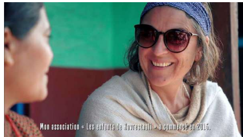
Mon association « Les enfants de Kavresthali » a commencé en 2015.