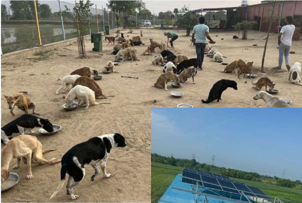
Vosa - Canicule panneaux solaires