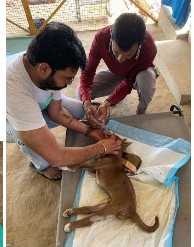
VOSA – Voice of Stray Animals