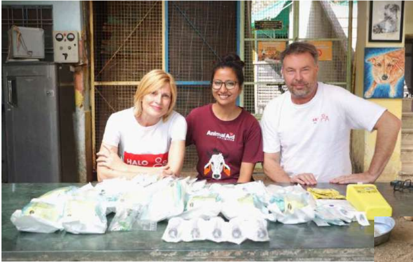
AAU – Animal Aid Unlimited