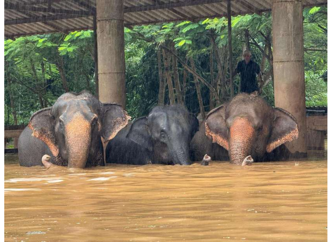
Elephant Nature Park - Inondations