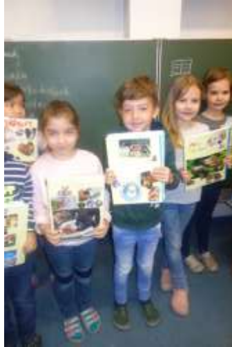
Stolz auf individuelle Tierhefte