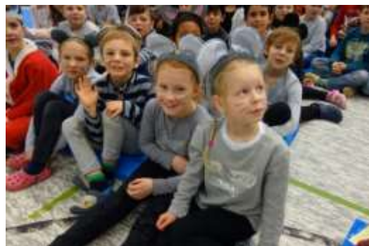
„Die Weihnachtsmaus“ - Weihnachtsfeier in der Turnhalle