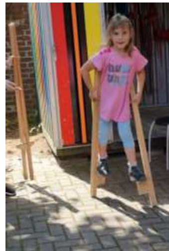
Stelzen laufen vor der Regenbogenkiste