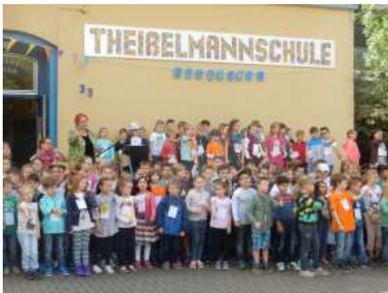
Auftakt zum Schulfest „Alle Kinder haben Rechte“