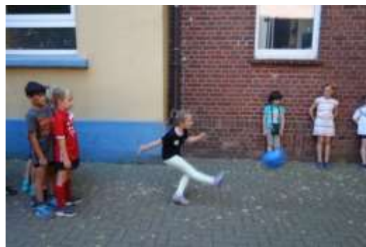
Torwandschießen am Giraffen-Fußballtag