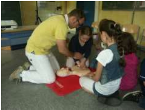
Erste Hilfe-Übungen mit einem Arzt