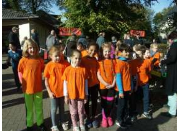
Gemeinsamer Sponsorenlauf für unseren Zirkus