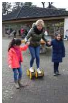
Kleine helfen Großen