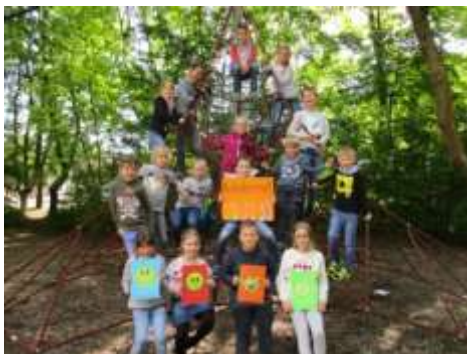
Kinderrat der Theißelmannschule