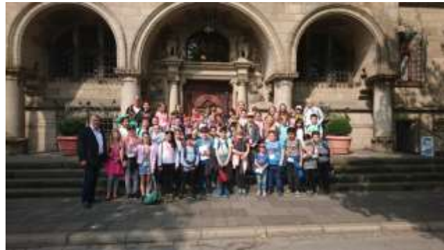
Unterrichtsgang zum Duisburger Rathaus mit Fragestunde