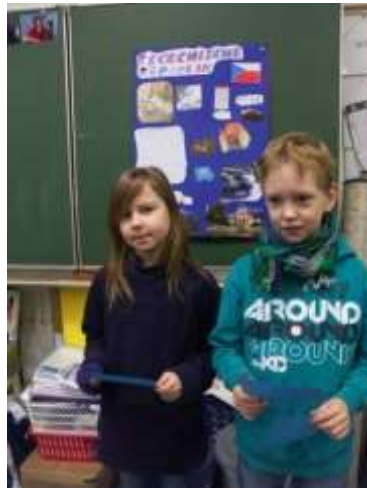
Referat über europäische Länder