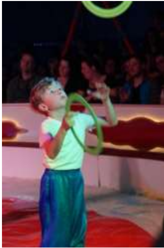
Jonglieren in der Zirkusmanege