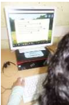
LRS-Förderung am PC