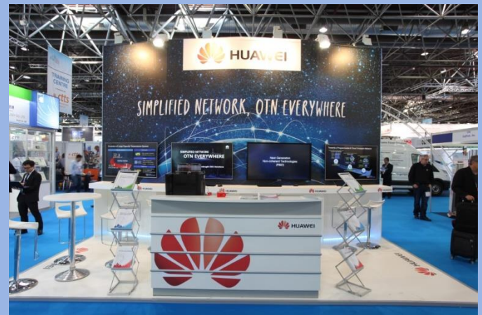
Huawei, medical congress, Düsseldorf, 42m 2