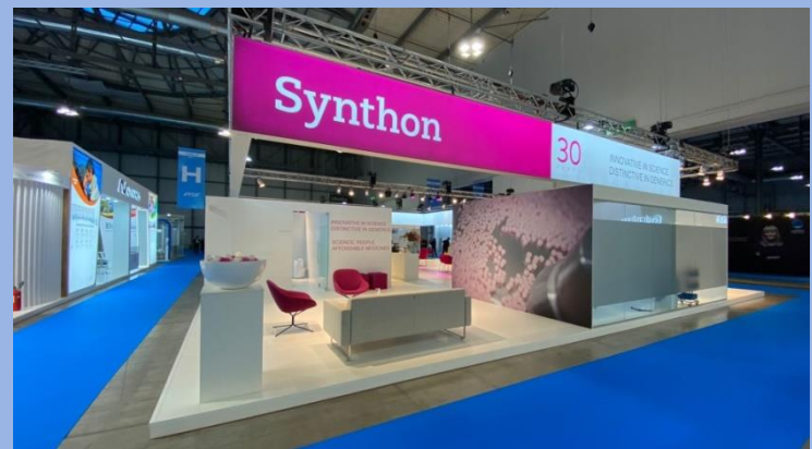
Synthon, Milano, 300m 2