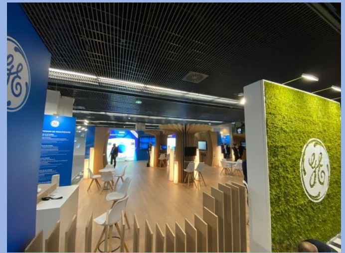
GE Medical, medical exhibition Paris, 180m 2