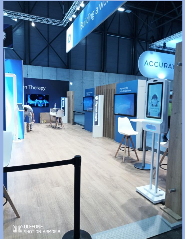
GE, Estro Madrid, 160m 2