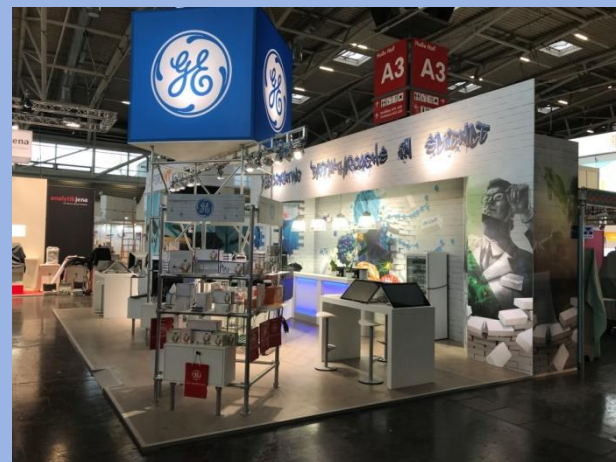
GE Analytica, medical congress, Stuttgart, 72m 2