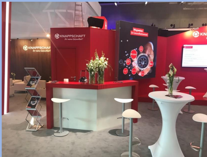
Knappschaft Krankenkasse, medical congress, Stuttgart, 72m 2