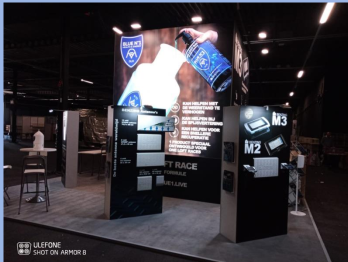
Benzing, houten, Belgium, 64m 2