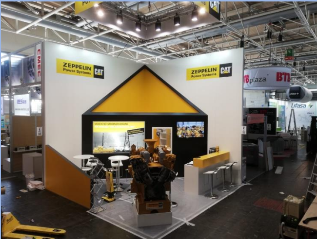
Zeppelin, HMI Hannover, 25m 2