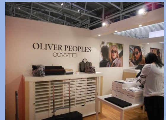
Oliver Peoples, Silmo Paris, 160m 2