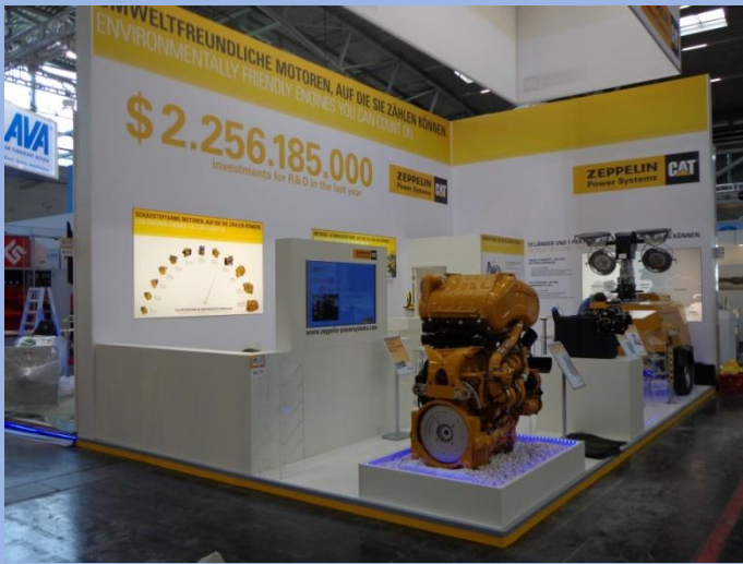
Zeppelin, IFAT Munich, 2014, 42m 2