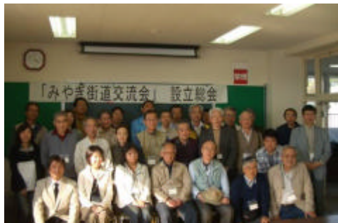
みやぎ街道交流会 設立の記念撮影

平成 19 年 5 月 3 ~ 4 日、塩竈市（浦戸諸島）野々島及び寒風沢島において開催された「街道と舟運について高倉先生と語る会 in 寒風沢」において、「みやぎ街道交流会」を設立しました。