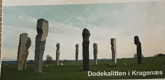
Dodekalitten i Kragenæs

Kragenæs er en central placering for øernes mange oplevelser til lands og til vands. Kragenæs ist ein zentraler Ort für die viele Erfahrungen auf dem Land der Inseln und auf dem Meer.