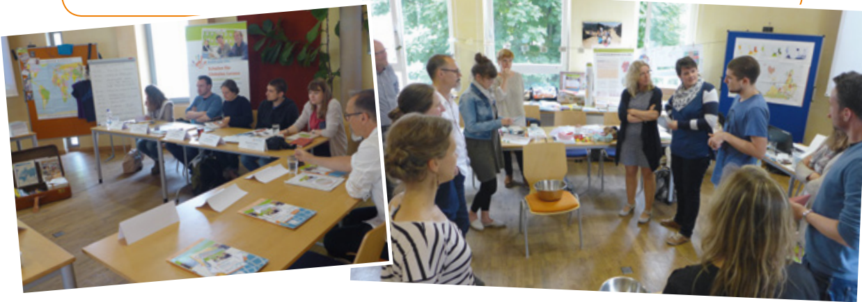
Schulformübergreifende Multiplikator_innenwerkstatt mit Methodenwerkstatt »Globales Lernen/BNE« für den Fachunterricht in der Sek I und II