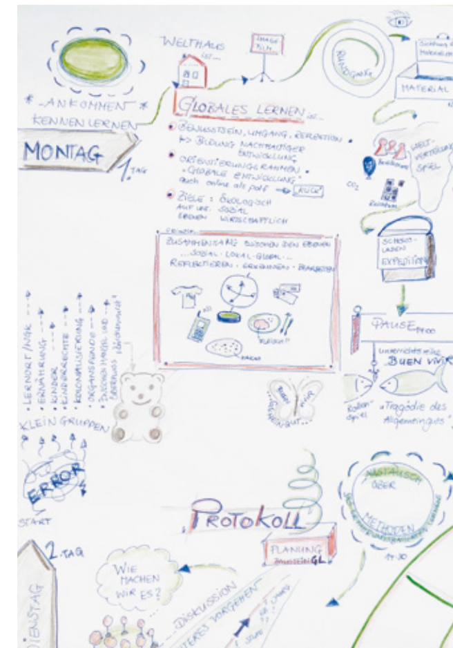
Protokoll Lehrer_innenfortbildung (Laborschule)