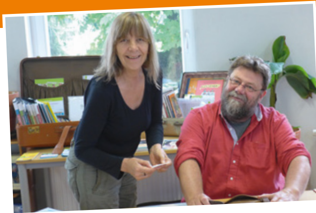
Austausch von Mitarbeiter_innen aus NROs zum Thema »Schulentwicklung Globales Lernen«

Die im Vorgängerprojekt erarbeiteten »Tipps an die Schulen und NROs« wurden überprüft und bestätigt und es wurden (weitere) Vorschläge für eine bessere strukturelle