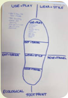
Foto: Plakat zum Ökologischen Fußabdruck

Wie geht es weiter? In ihrer Rolle als Multiplikator_innen geben die Lehrer_innen ihre Kompetenzen und Erfahrungen im Bereich Globales Lernen an ihre zukünftigen Schulen weiter.