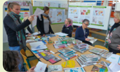
Foto: Zweitägige schulinterne Lehrer_innenfortbildung (SchILF), »Lernen für ein nachhaltiges und globales Leben«, Materialecke

Wie geht es weiter? Zusätzlich möchte die Schule gerne noch mehr Bausteine des Welthaus Bielefeld e.V. im Curriculum einarbeiten.