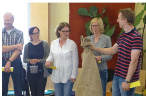
Lehrer_innen der Realschule Halle bei einer Ganztagsfortbildung für das Gesamtkollegium