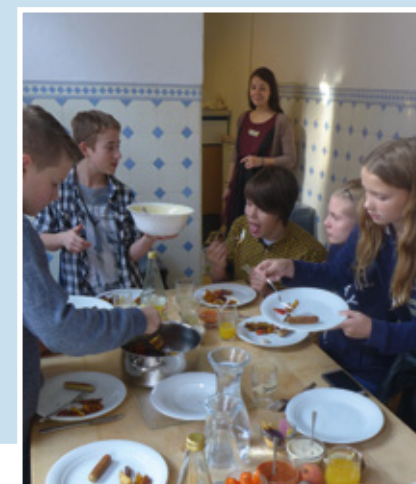
Foto oben: Schüler_innen sammeln Ideen für Aktionen im Unterricht und Schulalltag (Verkauf von Fairtrade-Produkten etc.); Foto rechts: Klimafreundliches Essen in Gemeinschaft

Nach einer spielerischen Auseinandersetzung mit den theoretischen Hintergründen im Vormittag und einem gemeinsamen Mittagessen werden im Nachmittag in Kleingruppen konkrete Handlungsoptionen für die Umsetzung im Schulalltag (Aktionsideen für die Faire Woche oder Klimawoche, Verkauf von FairTrade-Produkten im Schulkiosk, Verwendung von FairTrade-Abi-T-Shirts etc.) gesammelt.