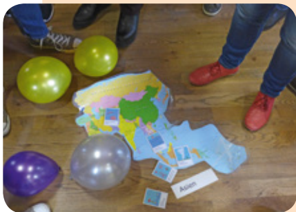
Foto: CO 2 -Emissionen und Klimawandelfolgen nach Weltregionen (Weltverteilungsspiel)

Wie geht es weiter? Es sollen Angebote Globalen Lernens in den Fächern Gesellschaftslehre und Religion/ Praktische Philosophie in der Sekundarstufe II erprobt werden. Außerdem werden Bildungsprojekte und -materialien zum Inklusiven Globalen Lernen in den Fachschaften vorgestellt.