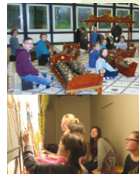
Foto: Schüler_innen beim indon. Gamelan mit Schattenfigurenspiel (Jugendhof Vlotho)

Wie geht es weiter? Für eine bessere Nachhaltigkeit soll der Prozess durch die pädagogischen Gremien begleitet werden.