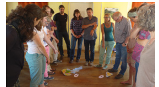
Multiplikator_innenwerkstatt »Inklusives Globales Lernen« (Materialanpassung)

Das Welthaus Bielefeld e.V. hat in Kooperation mit Behinderung und Entwicklungszusammenarbeit e.V. (bezev) damit begonnen, Vertreter_innen von Schulen und NROs fortzubilden.