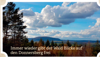
Immer wieder gibt der Wald Blicke auf den Donnersberg frei

Der Prädikatsweg führt uns nun nach Nordwesten (ca. 100 m) und danach ca. 3 km parallel zur Straße über Pfade nach Nordosten bis zur L 396, die wir überqueren.