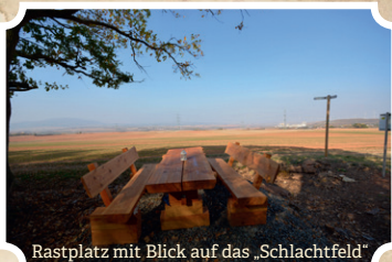
Rastplatz mit Blick auf das „Schlachtfeld“

Hier sollten Sie einen kleinen Abstecher (ca. 100 m) nach Südosten zum Keßler Kreuz (bergan) unternehmen.