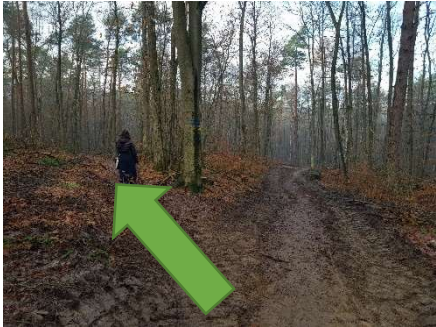
Foto: Weggabelung oberhalb Kriemhildenstuhl

Nach insgesamt drei Kilometern sind die Markierungen durch Baumfällarbeiten unterbrochen.