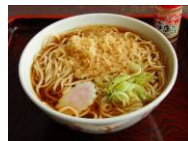
【写真左】 噂のため中 【写真中上】 六郷宿の街並 【写真中中】 探訪会の様子 【写真中下】 交流会の様子 【写真右】 藤清水

くの雨となりましたが、羽州街道の裏手などにひっそり湧き出る清水をめぐり、同時開催されていたお茶会にも参加しました。また、今回は是非お勧めしたいのは、美郷町で現在売り出し中のB級グルメ「たぬ中」! たぬきうどんのつゆに中華麺を入れたものですが、たぬきが上手く味を含んで良いお味です。美郷にお越しの際は是非お試しあれ!