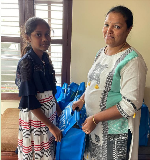
Ausgabe der neuen Schülbücher

“Bildung ist die mächtigste Waffe, die du verwenden kannst, um die Welt zu verändern!” (Nelson Mandela)