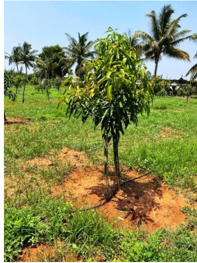
Die ersten frischen Triebe der neu gepflanzten Mangobäume