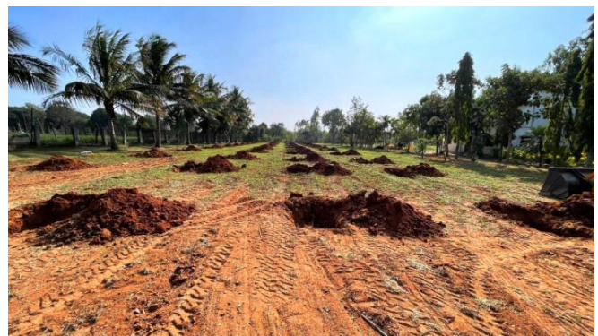
Vorbereitung und Anpflanzung neuer Mangobäume