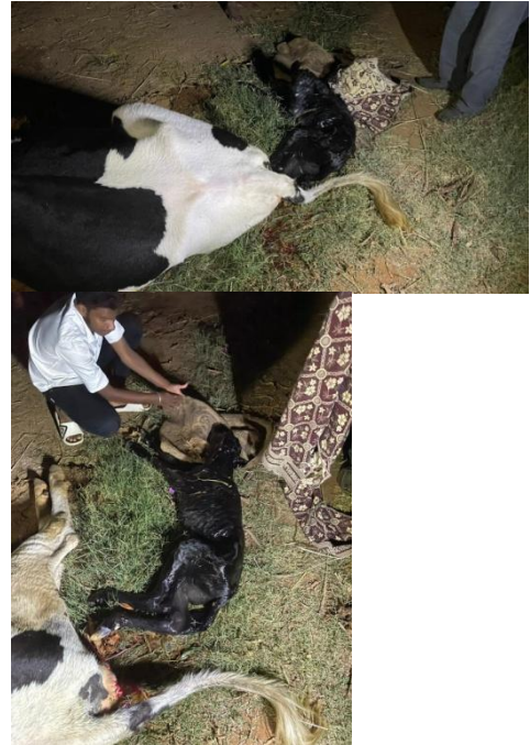
... und ein kleines Kälbchen wird geboren