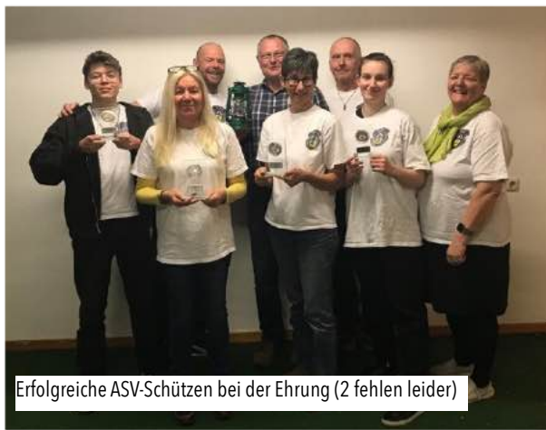
Erfolgreiche ASV-Schützen bei der Ehrung (2 fehlen leider)