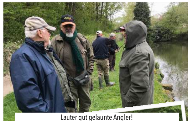
Lauter gut gelaunte Angler!

Das Ergebnis des ca. einstündigen Gesprächs ist, dass wir auf jeden Fall die Wasserrechte für die Anlage wieder erteilt bekommen. Am 07. Mai gab es einen weiteren Termin mit Vertretern des Bauamtes der Gemeinde Hüttenberg und der UNB des Lahn-Dill-Kreises wegen der Eingriffsgenehmigung für die Umbaumassnahmen an den Teichen. Auch hier liefen die Gespräche gut, so dass wir hoffen, die Genehmigung kurzfristig zu erhalten.