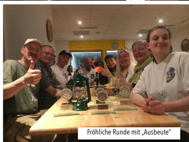
Fröhliche Runde mit „Ausbeute“