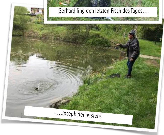
... Joseph den ersten!