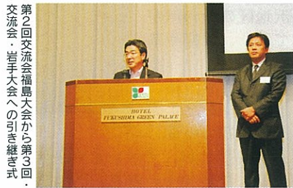
第2回交流会福島大会から第3回交流会・岩手大会への引き継ぎ式