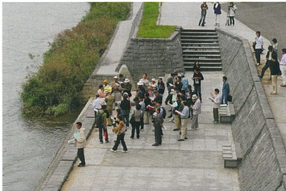
復元された福島河岸