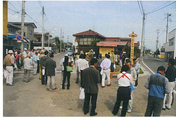
桑折の奥州・羽州街道追分につくられた公園