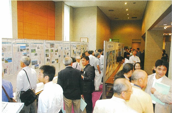
にぎわうパネル展