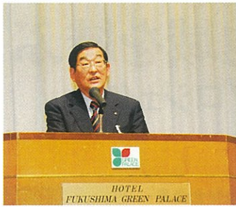
開会あいさつ・福島市長 瀬戸孝則氏