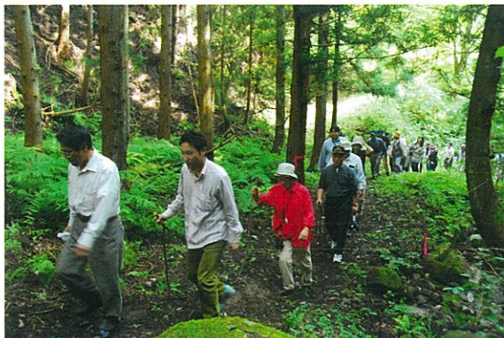
羽州街道一の難所だった小坂峠