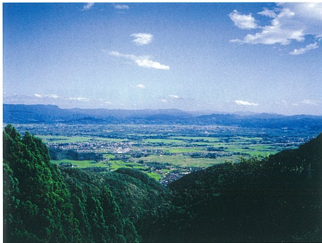
小坂峠より信達平野を望む

道を介して他の地域との交流をはかり、そこから生まれる歴史と文化に親しむ活動を通じて、地域コミュニティの再生を目指すのが日本風景街道だ。全国から72ルートの応募があり、東北からの応募は10ルートだった。キーワードは歴史、民話とか伝統芸能、文化、自然景観、町並みなどで、国土交通省では仕組みづくりについて検討している。