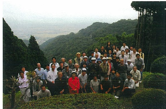
小坂峠頂上で記念撮影