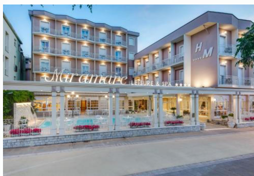
Hotel Miramare ****