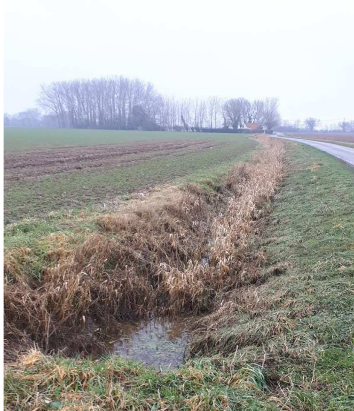
Fossé sans écoulement d'effluent, de digestat.

Les photos parlent d'elles-mêmes. La coloration des terres témoignent du degré de pollution, reflétant un écoulement permanent de digestat ou d'eau chargée.