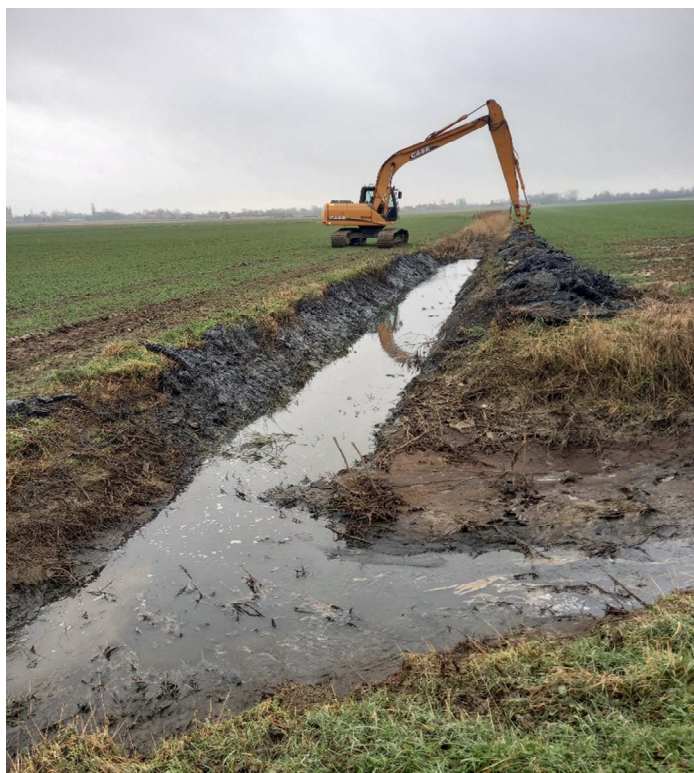
Curage du fossé déclenché sur la demande de la mairie, et la pollution existante !!