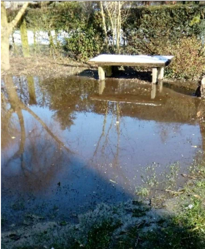
Conséquence d'un débordement de digestat chez un riverain à 250m du méthaniseur