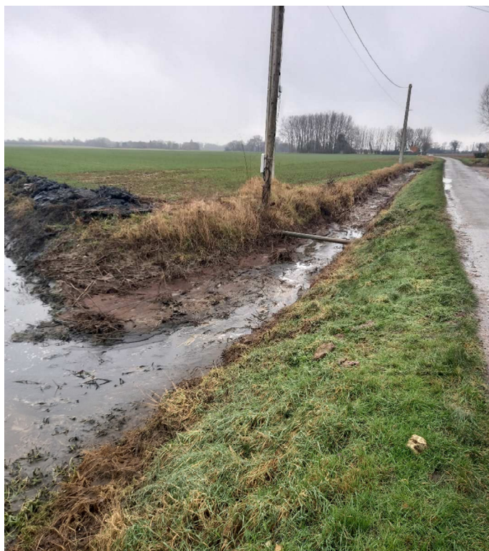
Vous pouvez observer l'état lamentable du fossé non curé !!