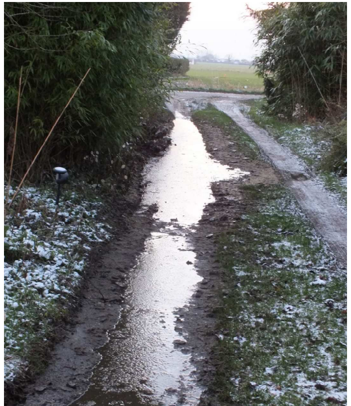
Conséquence d'un débordement de digestat dans l'accès d'un riverain situé à 300m du méthaniseur.

CETTE POLLUTION N'EST CERTAINEMENT PAS UN CAS ISOLÉ ET IL APPARTIENT À CHACUN D'ENTRE NOUS DE LES RECENSER POUR AGIR !