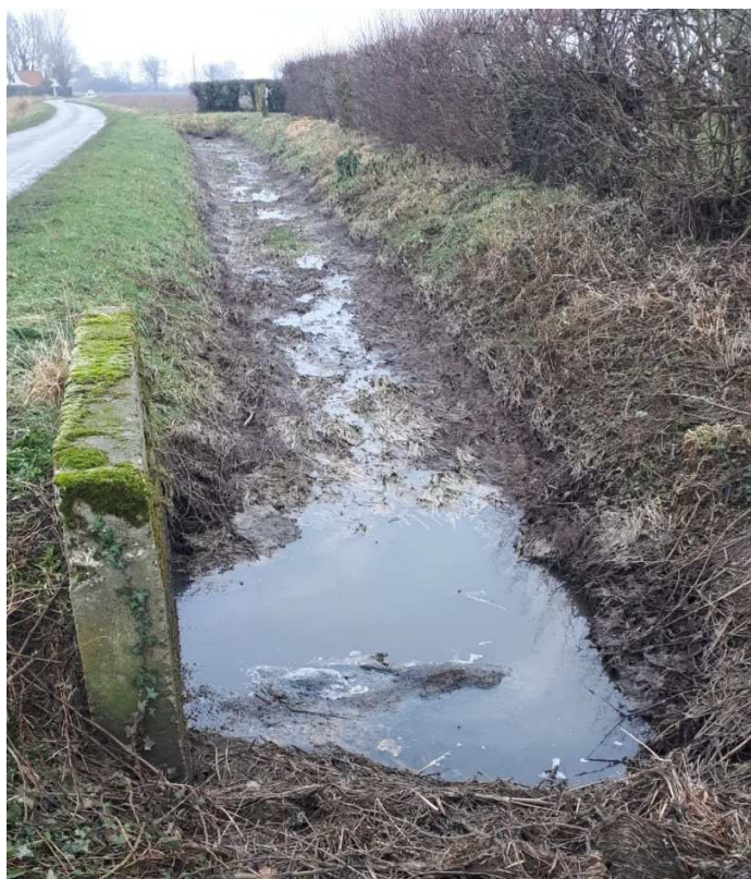
Fossé chargé de digestat.