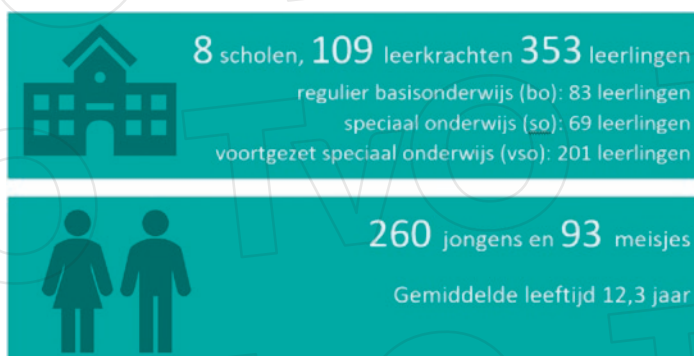
Figuur 2. Overzicht van deelnemers aan het evaluatieonderzoek

Met betrekking tot het klassenklimaat zien we dat leerkrachten de interactie met de leerlingen positiever ervaren dan in het jaar voor implementatie. Daarnaast ervaren leerkrachten in het implementatiejaar een betere sfeer in de klas dan in het voorgaande jaar. Dit laat zien dat het implementeren van traumasensitief onderwijs een positief effect heeft op het klimaat in de klas.