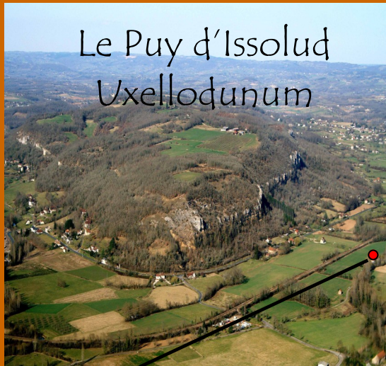
Le Puy d'Issolud Uxellodunum

Uxellodunum est le nom d'un oppidum gaulois, situé dans le Quercy actuel. Il est surtout connu pour avoir été le lieu de la dernière bataille de la guerre des Gaules , en -51 , César emportant la reddition de la place à la suite de son siège. Son nom signifie la « forteresse élevée » ( uxel , élevé, et dunum , latinisation du gaulois dunon , forteresse - voir Dun ). C'est un nom gaulois assez répandu qui a évolué en Issolud , Issoudun , Exoudun 1 . Longtemps objet de débats 2 , la localisation d'Uxellodunum au Puy d'Issolud est désormais reconnue par la communauté scientifique 3 . Localement cette identification reste parfois contestée par des particuliers et des associations: Capdenac-le-Haut, situé dans une boucle du Lot, se rapproche également de la description faite dans la Guerre des Gaules par Jules César.