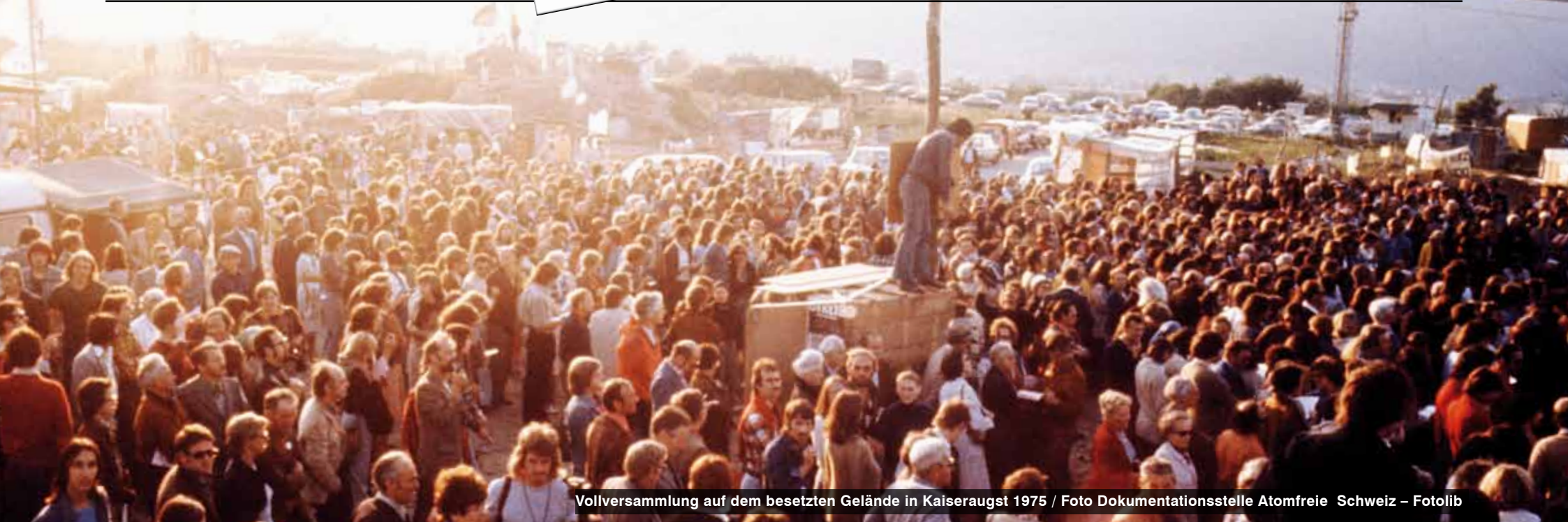
Vollversammlung auf dem besetzten Gelände in Kaiseraugst 1975