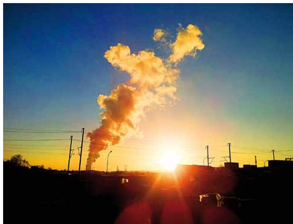
Gösgen im Strahlenmeer

Im Wendeblatt Nr. 25 haben wir auf diese Aktion hingewiesen. Dank des Entgegenkommens von Autor und Verlag und der Spenden unserer Mitglieder waren wir in der Lage, 100 Exemplare zu beschaffen. Als Zielgruppe haben wir Ratsmitglieder aus dem bürgerlichen Lager gewählt, bei denen die Hoffnung besteht, dass sie das Problem Atommüll ernst nehmen. Im April 2020 werden die Bücher ihre Adressaten erreichen, zusammen mit einem Brief, in dem wir darauf hinweisen, dass es wohl klüger wäre, nicht dauernd noch mehr Atommüll zu produzieren, wenn man schon nicht weiss, wohin damit. Die 146 restlichen Ratsmitglieder erhalten anstelle des Buches eine Nach-