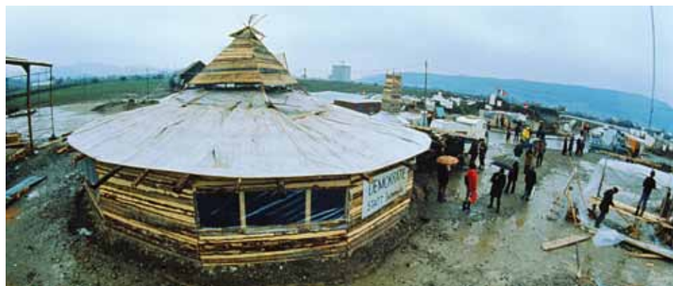
Das Freundschaftshaus auf dem besetzten Baugelände in Kaiseraugst 1975