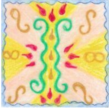
erhältlich im Format ca. 5 x 5 cm

Ein Leuchtfeuer öffnet den Weg für dieses weiß-goldene Licht.