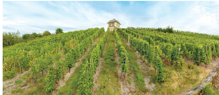
Einer der HEM Weinberge in Mülheim an der Mosel.

Das einzigartige trinkbare Kunstwerk aus der HEM limitierte Edition ist eine gelungene Mischung aus Tradition, Wein und Kunst und sorgt durch ein spannendes Gesamtkonzept für innovative Impulse.