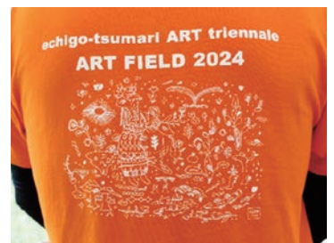
2024 おもてなし Tシャツ 作家榎木野さんのデザインです。