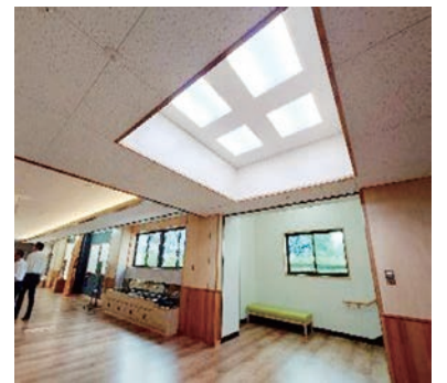
吹き抜けをイメージした照明