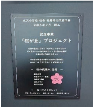
桜が丘プロジェクト

正面入り口入って、改修前は階段前のスペースが暗かったので、改修後は、吹き抜けをイメージした照明で明るく仕上げることに力を入れた。様々な部分で工夫を凝らして充実した仕上がりとなりました。編集委員 F・C