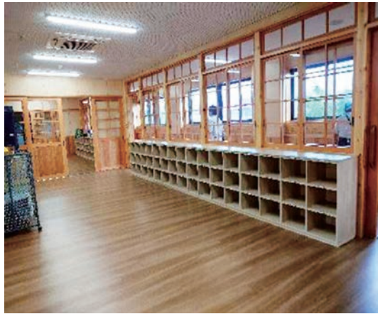
教室オープンスペース