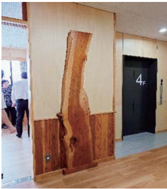
桜の木を利用した身長計