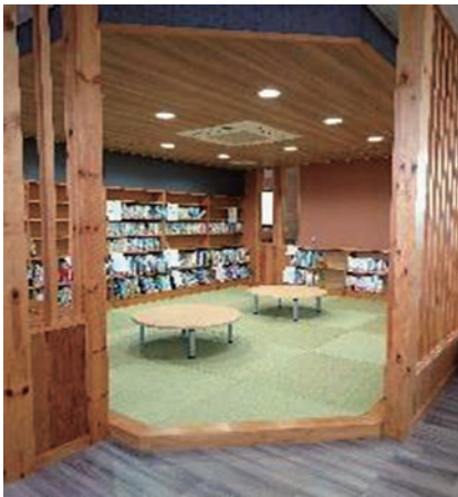
図書室畳コーナー