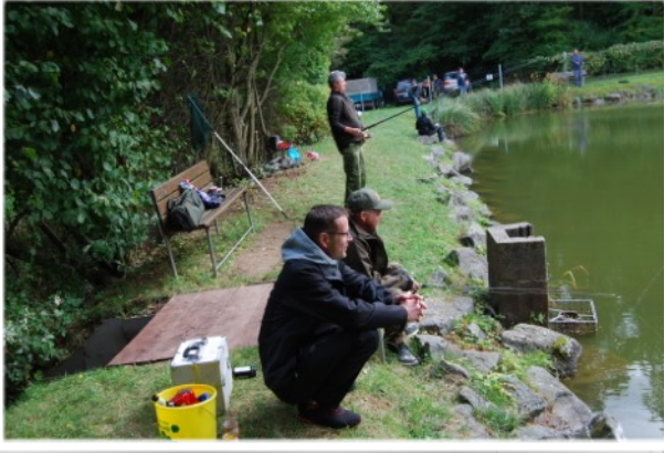
Die Fische lassen sich Zeit