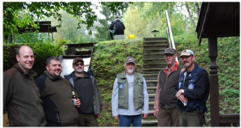
Vier Angler, fünf Jäger und doch nur sechs Personen! Da sieht man, wie ähnlich die Interessenlagen sind. Mitglieder und Gäste hatten gleichermaßen Spaß.