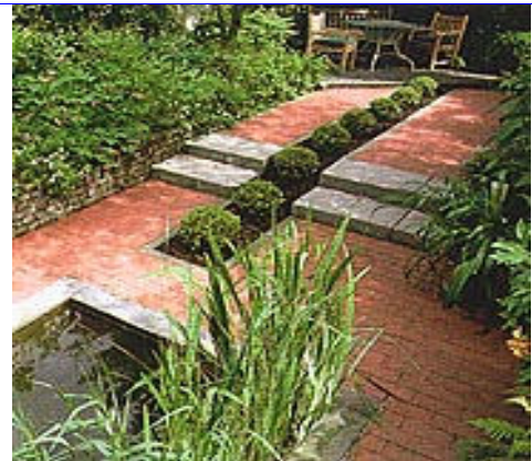
saubere Wege in blühenden Gärten