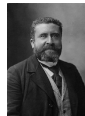
Jean Jaurès (1859-1914)

Né à Dijon, il entre à l'École centrale à Paris et devient dès lors l'un des plus grands ingénieurs et des plus grands industriels français de la fin du XIX ème siècle. Il travaille pour des compagnies de chemins de fer et construit des viaducs puis est retenu pour construire la Tour Eiffel mais aussi la Statue de la Liberté.