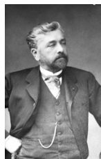
Gustave Eiffel (1832-1923)

Industriel issu d'une grande famille originaire du Creusot, il est à la tête de l'entreprise sidérurgique familiale. Il occupe aussi des fonctions à la Banque de France et des fonctions politiques (député-maire du Creusot). Dirigeant paternaliste, il institue un système de retraite pour les ouvriers de son entreprise.