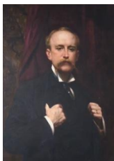
Henri Schneider (1840-1898)

Industriel issu d'une grande famille originaire du Creusot, il est à la tête de l'entreprise sidérurgique familiale. Il occupe aussi des fonctions à la Banque de France et des fonctions politiques (député-maire du Creusot). Dirigeant paternaliste, il institue un système de retraite pour les ouvriers de son entreprise.