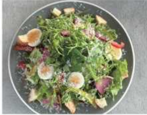
2. 濃厚チーズのシーザーサラダ 700 (770) 2~3名様サイズ