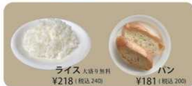
ライス 大盛り無料 ¥218 (税込240)