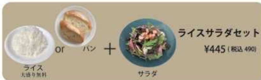
ライスサラダセット