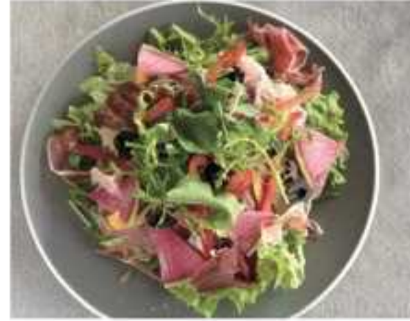
3. 生ハムといろいろ野菜のサラダ 800 (880) 2~3名様サイズ