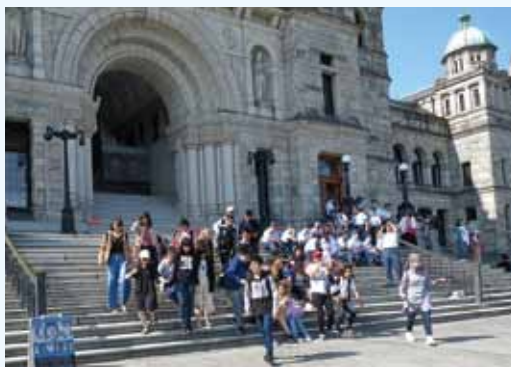
州議事堂前にて In front of the Parliament buildings