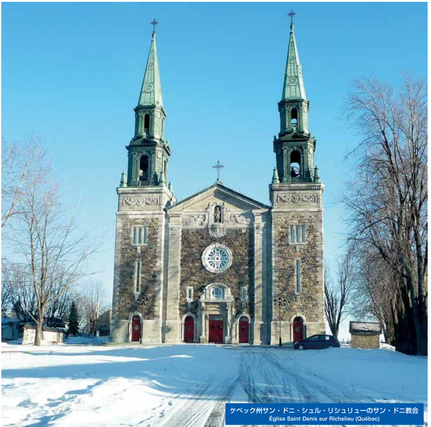
ケベック州サン・ドニ・シュル・リシュリユーのサン・ドニ教会 Église Saint Denis sur Richelieu (Québec)