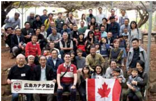
藤棚の下で Under the wisteria trellis