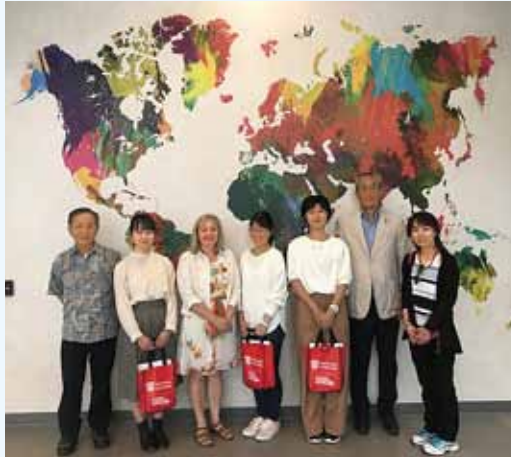
ビクトリア大学訪問（筆者：左端） Visit to the University of Victoria (author on left)