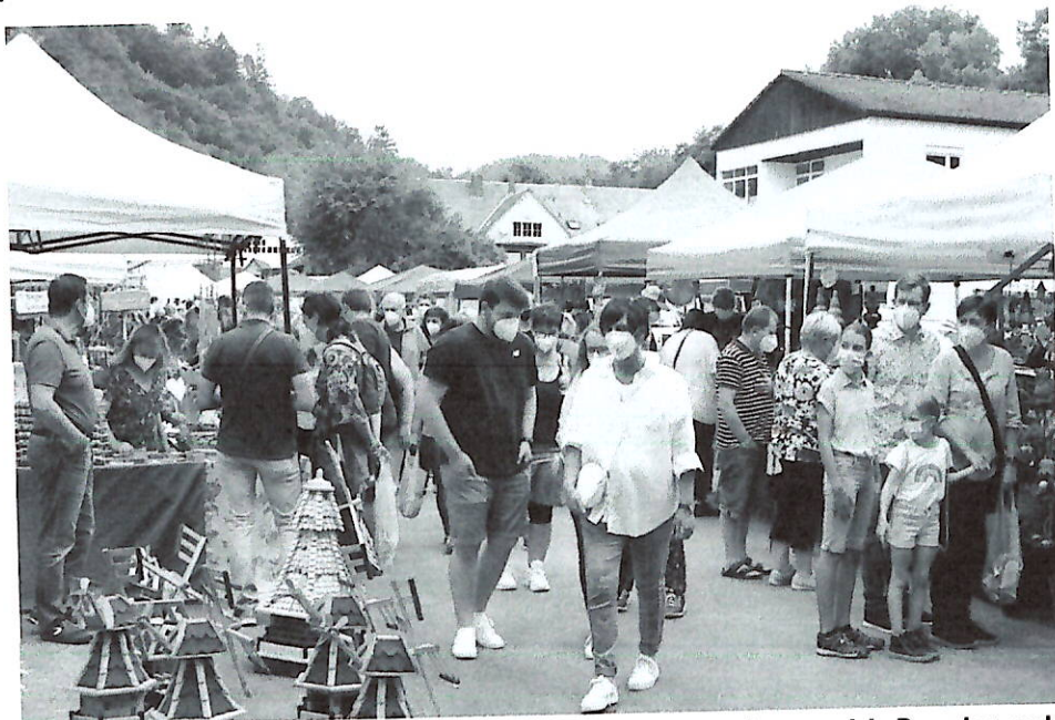
Der Hobby- und Künstlermarkt am Anger lockte am vergangenen Sonntag viele Besucher nach Bad Berneck.

Die Händler selbst zeigten ein breitgefächertes