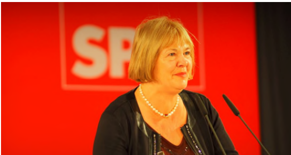
11.11.17: SPD-Landespartei tag in Neumünster - als stellv. Landesvorsitzende eröffne ich seit elf Jahren jeden Parteitag in Schleswig-Holstein.