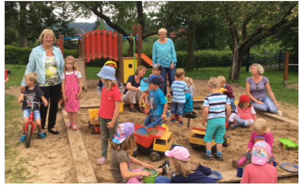
20.07.17: 4.500 Kinderliederhefte habe ich 2017 verteilt: Hier im Kindergarten „Flohkiste“ in Kasseedorf, den ich vor 20 Jahren als Elterninitiative gegründet habe.