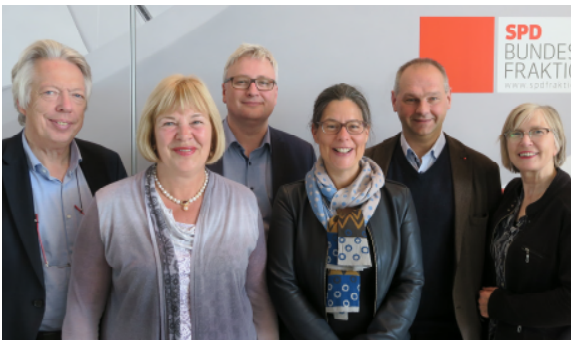
17.10.17: Sechs SPD-Bundestagsabgeordnete aus S.-H.: Dr. Ernst-Dieter Rossmann, Bettina Hagedorn, Sönke Rix, Dr. Nina Scheer, Mathias Stein und Gabrielle Hiller-Ohm.