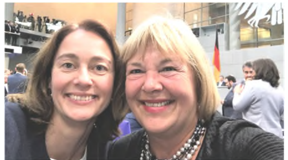
24.10.17: Mit Bundesministerin Katarina Barley während der konstituierenden Sitzung des 19. Bundestags.