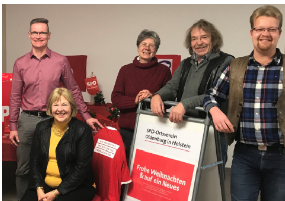
03.12.17: Neumitgliederfrühstück im SPD-Ortsverein Oldenburg