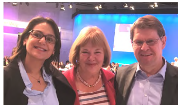
07.-09.12.17: Bundesparteitag der SPD in Berlin mit Ralf Stegner und Serpil Midyatli - beide wurden erneut in den Parteivorstand gewählt.