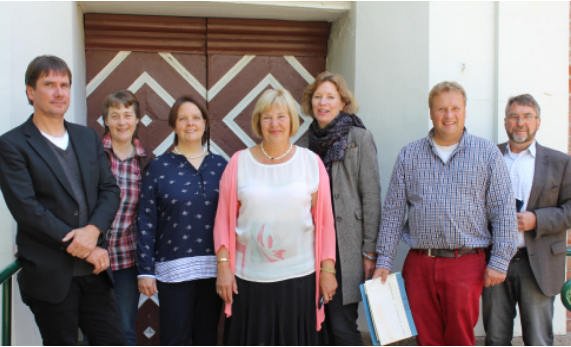
14.08.17: Besichtigung der Bauschäden der St.-Laurentius-Kirche in Süsel mit Fachleuten und Angehörigen des Kirchenvorstandes, für deren Sanierungsmaßnahmen ich Bundeszuschüsse einwerfen will.