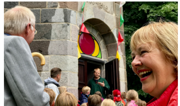
12.07.17: Der frisch renovierte Elisabethturm auf dem Bungsberg wird mit seinen kunterbunten Fenstern mit 200 Kindern der Friedrich-Hiller-Grundschule eröffnet.