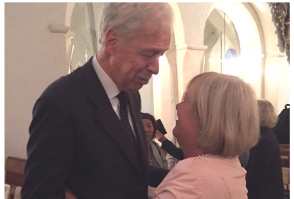
29.09.17: Festakt in der St.-Michaelis-Kirche in Eutin zum 20-jährigen Jubiläum der Hospizinitiative Eutin mit Bremens Bürgermeister a. D. Dr. Henning Scherf als Festredner.