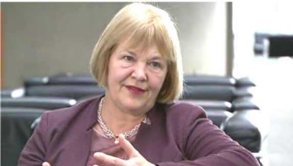
02.04.17: Interview für die ARD-Sendung "Bericht aus Berlin": Als verantwortliche Berichterstatlerin im Haushaltsausschuss will ich die Autobahnprivatisierung stoppen!