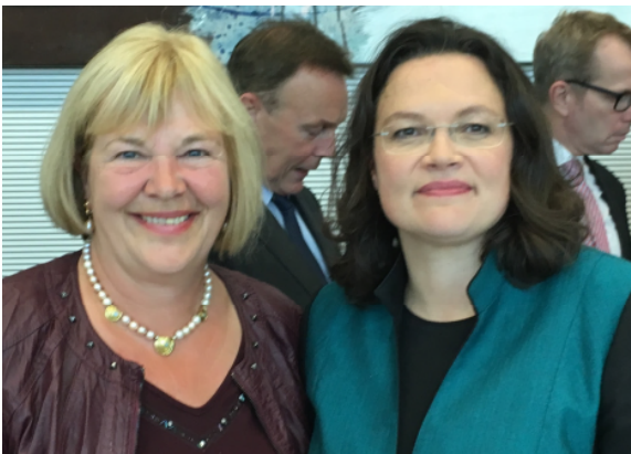
27.09.17: Gratulation für Andrea Nahles, die zur neuen SPD-Fraktionsvorsitzenden gewählt wurde.