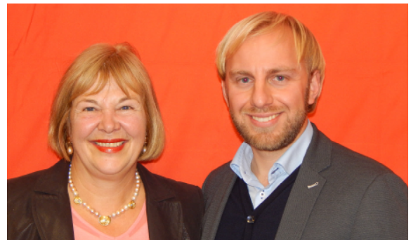
30.11.17: Gemeinsame Einladung zur SPD-Mitgliederkonferenz mit mehr als 60 Gästen in Eutin - spannende Debatten zur aktuellen Lage.