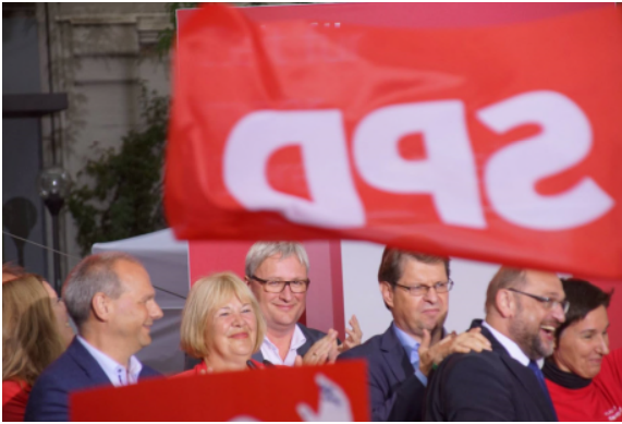
31.08.17: Zentrale SPD-Veranstaltung in Kiel mit SPD-Kanzlerkandidat Martin Schulz und Ralf Stegner auf dem gut gefüllten Asmus-Bremer-Platz.