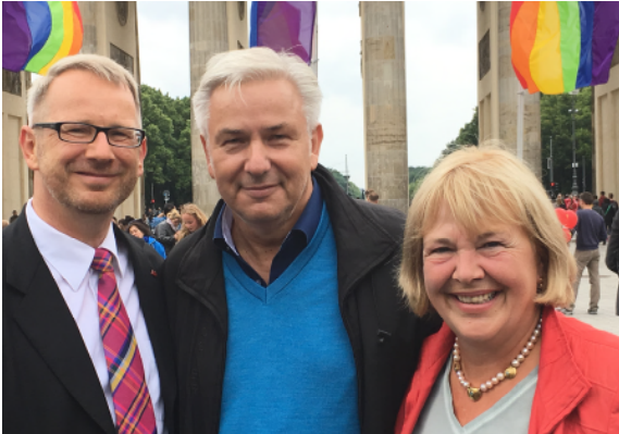
30.06.17: Fröhliche Open-Air-Feier am Brandenburger Tor unmittelbar nachdem der Deutsche Bundestag die „Ehe für alle“ beschlossen hat, zusammen mit meinem Haushaltskollegen Johannes Kahrs und dem ehemaligen Berliner Bürgermeister Klaus Wowereit.