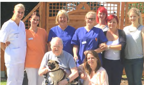
15.08.17: In Arbeitskleidung: Mein bereits 11. eintägiges Pflegepraktikum im Senioren- und Therapiezentrum Eichenhof in Stockelsdorf auf der Wachkomastation.