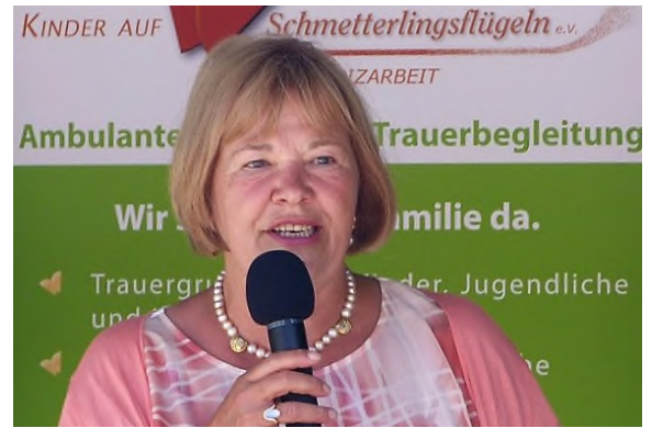
17.06.17: Grußwort beim 10-jährigen Jubiläum des Hospizvereins „Kinder auf Schmetterlingsflügeln“