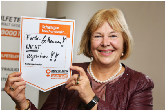
24.11.17: NEIN zu Gewalt gegen Frauen! - natürlich beteilige ich mich am Aktionstag "Schweigen brechen!"