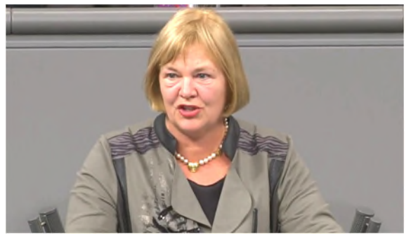
21.11.17: Meine erste Rede nach der Wahl zu Europa auf AfD-Antrag - am 13.12.17 folgte schon die zweite.