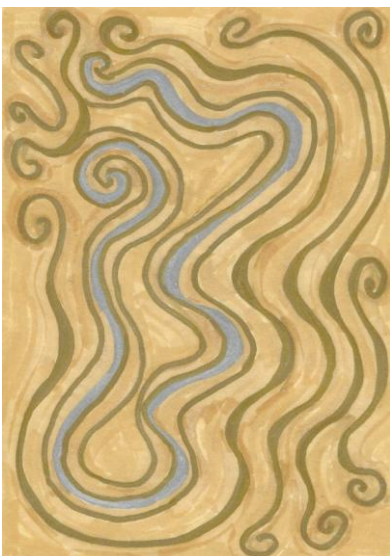
erhältlich im Format A6

Ein Fluss der Liebe entspringt in dir, öffne deine Pforten und lasse den Strom der Liebe mit all seinen Farben durch dich fließen, lasse den Strom der Liebe dich erfüllen und dich segnen. Liebe dich.