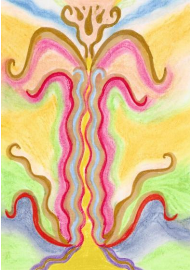
erhältlich im Format A6

Mit Paukengetöse öffnet Kali die erstarrte Asche in dir, liebevoll reicht sie dir ihre Hände und führt dich heraus. Engel der Liebe Hüllen dich ein und reinigen dein Seelenkleid. Lasse dich führen und nähren. Ein goldenes Tor öffnet sich und lässt dich ein, ein Segenslicht durchleuchtet und flutet dein Sein.