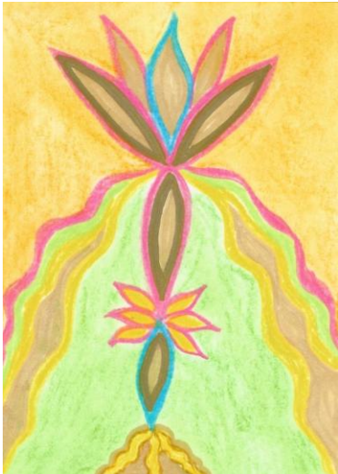
erhältlich im Format A6

Ein Tropfen, ein Same öffnet sich in dir, bereit dem Weg des Lichtes zu folgen. Die Dreieinigkei in dir ist erwacht. Ein Segenstrom aus bunten Farben durchflutet dich, füllt dich und wandelt dich, ganz sanft und zart zieht der Farbenstrom seine Bahnen und liebkost dich, öffnet eine Ebene in dir des Vertrauens und des Eins-Seins. Nehme an. Die Blüte in dir erwacht, öffnet ihr Haupt und strahlt und glänzt in die Welt hinaus. Genieße dein Licht, das du bist.