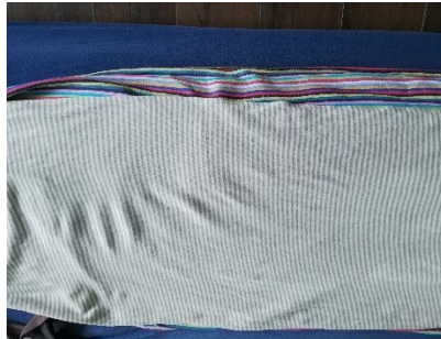
unten der feste RS von Didymos, oben der elastische RS von Didymos