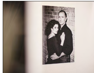
3-Schicht-Dibondplatte 3 mm, Laborfoto, laminiert, UV-geschützt, Aluprofilaufhängung