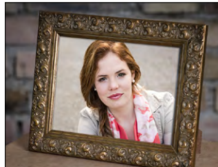
Qualitätsfoto matt oder glanz für Rahmung hinter Glas oder Album

Wandvergrößerungen hergestellt in liebevoller Handarbeit aus der Region in herausragender Qualität. Die entsprechende Bilddatei erhalten Sie beim Kauf einer Dibondplatte oder Leinenbild kostenlos dazu bzw. wird Ihnen die bereits erworbene Bilddatei auf das entsprechende Wandbild gutgeschrieben.