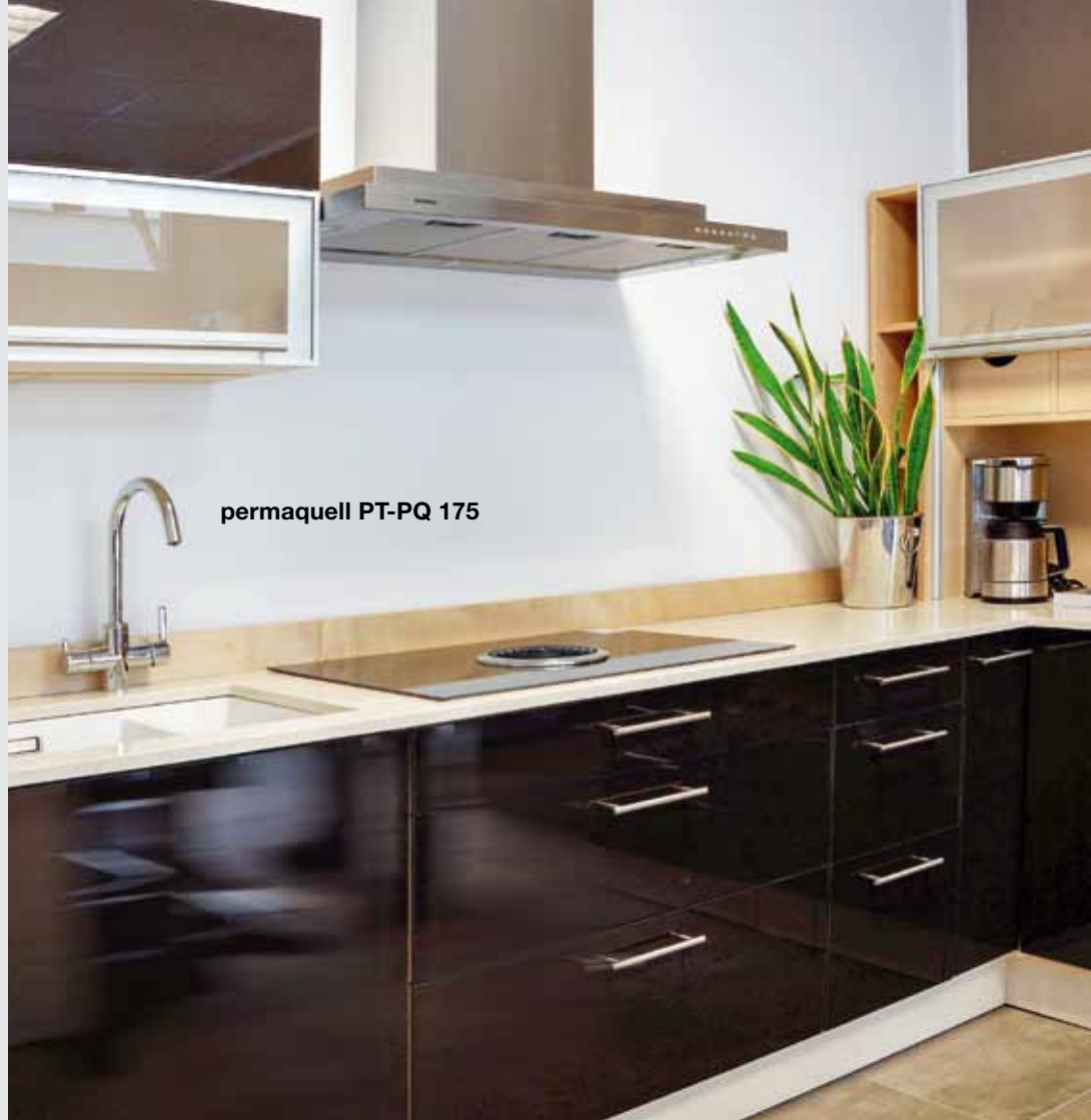
permaquell PT-PQ 175