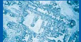
Stadtwasser ohne Behandlung