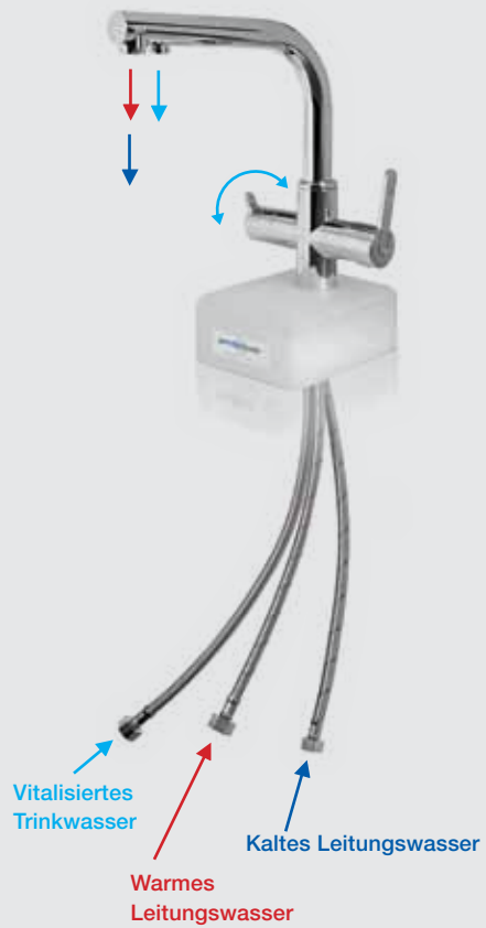
permaquell PT-PQ 245