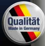
vital premium PT-VP 10