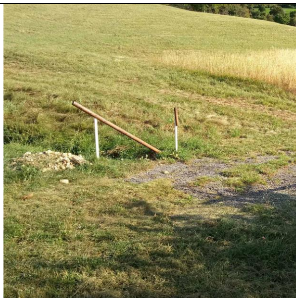
Cimetière du Castellard Barrière de signalment et de prévention du public détériorée en 2017 et à nouveau en 2018