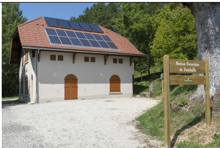
Rénovation terminée de la maison forestière ONF du col de Fontbelle