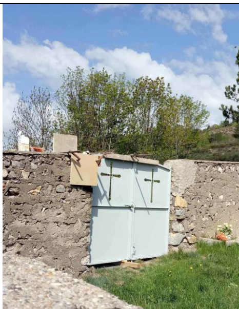
Cimetière de Mélan Réparation : scellement de gong