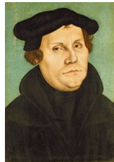
Martin Luther (1483-1546)

Sculpteur, peintre, architecte et poète italien, Michelangelo Buonarroti travaille pour Laurent de Médicis à Florence (il sculpte le David ). En 1508, le pape Jules II le charge d'orne le plafond de la Chapelle Sixtine avec des scènes de la Genèse mais aussi le mur oriental de la chapelle avec la scène du Jugement Dernier.