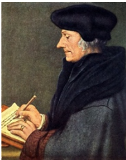
Didier Érasme (1469-1536)

Moine humaniste hollandais, il étudie la théologie à l'Université de Paris puis est ordonné prêtre en 1492. Érasme renonce à la carrière ecclésiastique pour se consacrer aux études : il multiplie les enseignements dans les universités et publie en 1516 la première édition critique du Nouveau Testament .