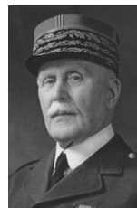
Philippe Pétain (1856-1951)

Entré au Parti nazi dès 1923, il devient le chef de la SS en 1929 et de la Gestapo en 1934. Il est le principal responsable de l'administration du système concentrationnaire puis de la Solution finale. Il se suicide en 1945 après son arrestation par les britanniques.