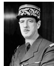
Charles de Gaulle (1890-1970)

Officier perçu comme le vainqueur de la bataille de Verdun en 1916, il est appelé à la tête du gouvernement en mai 1940, après l'invasion allemande, il propose l'armistice puis la collaboration. Chef de l'État français de 1940 à 1944, il est jugé en 1945.