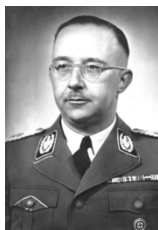
Heinrich Himmler (1900-1945)

Combattant en France pendant la Première Guerre mondiale, il adhère au parti démocrate puis est élu sénateur en 1934. Élu vice-Président de Roosevelt en 1944, il lui succède à sa mort. Président de 1945 à 1953, il lance deux bombes atomiques sur le Japon.