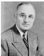
Harry Truman (1884-1972)

Combattant en France pendant la Première Guerre mondiale, il adhère au parti démocrate puis est élu sénateur en 1934. Élu vice-Président de Roosevelt en 1944, il lui succède à sa mort. Président de 1945 à 1953, il lance deux bombes atomiques sur le Japon.