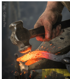
Schmiedekurs für Große