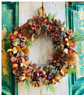
Herbstkranz- bzw. Adventkranzgestaltung