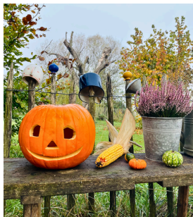
Veranstaltungen passend zum Jahreskreis