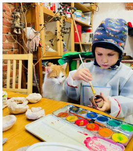
diverse Handwerkskurse & Workshops für Groß & Klein