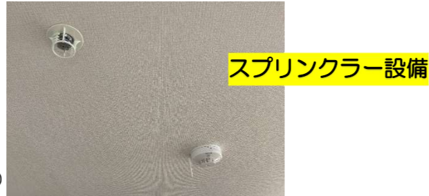
スプリンクラー設備