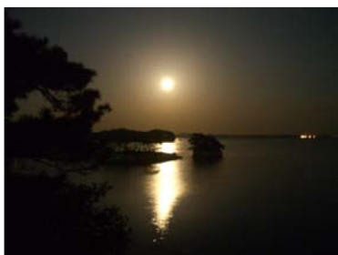
「松島・雄島の月」 みやぎ街道交流会 山屋撮影

撮影者からのコメント： 念願叶って「松島・雄島の満月」を観られました。写真は座禅堂の前から東南方向を撮影したものです。