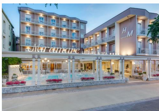
Hotel Miramare ****