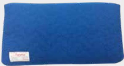
REISSFESTES KISSEN NHU-720 36 x 61 cm