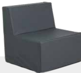
SESSEL NH-120 L 80 x B 80 x H 80 cm