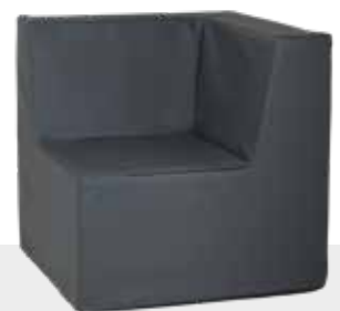
ECKSESSEL NH-130 L 80 x B 80 x H 80 cm