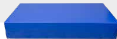
BETT NH-010 L 200 x B 90 x H 35 cm