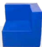
ECKSESSEL NH-030 L 80 x B 80 x H 80 cm