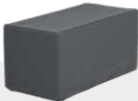
BANK / TISCH NH-170 L 80 x B 41 x H 41 cm