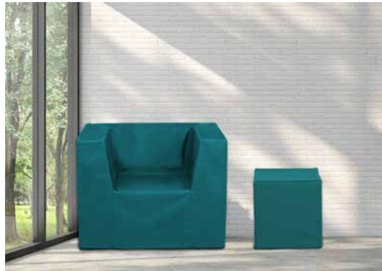
Farbe der Möbel im Bild: Türkis

Es gibt den Lehnssessel in der Standardausführung und in einer kleineren Ausführung für Kinder und Jugendliche.