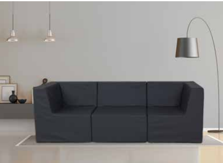
Farbe der Möbel im Bild: Graphite

Unsere modularen Sicherheitsmöbel überzeugen neben ihrer Widerstandsfähigkeit und ihrem Komfort auch durch ihre Optik, Pflegeleichtigkeit und Flexibilität. Jedes Möbelstück besteht aus einem hochwertigen Schaumstoffkern und einem strapazierfähigen Kunstlederbezug und wird fachmännisch von Hand hergestellt.