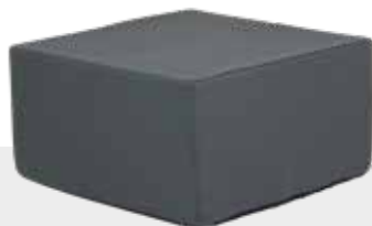
TISCH / SOFAMODUL NH-140 L 80 x B 80 x H 41 cm

Aufgrund der angenehmen Oberfläche, den vielen Farbmöglichkeiten und dem Fehlen von harten Materialien, sind unsere Möbel perfekt fürs Snoezelen geeignet!