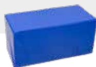
BANK / TISCH NH-070 L 80 x B 41 x H 41 cm