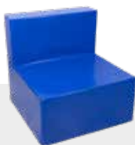
SESSEL NH-020 L 80 x B 80 x H 80 cm