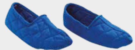
REISSFESTE HAUSSCHUHE NHU-760-Größe Größen S - XL