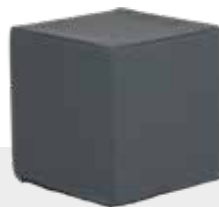
HOCKER / NACHTTISCH NH-160 L 41 x B 41 x H 41 cm