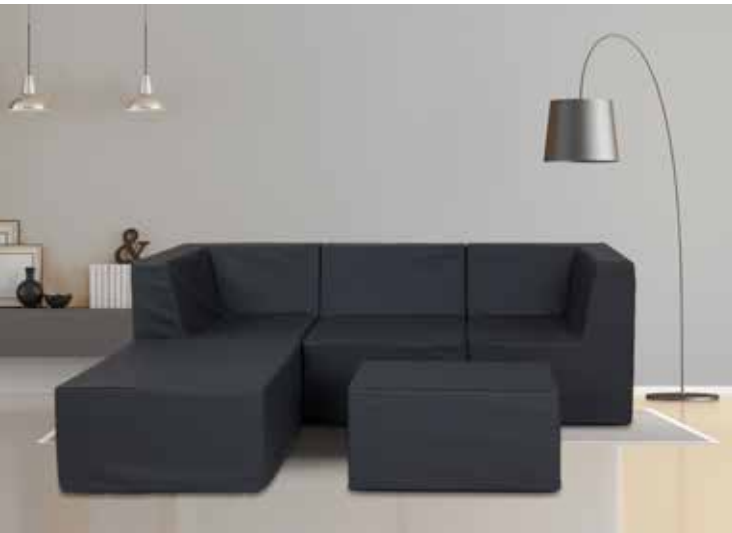
Farbe der Möbel im Bild: Graphite