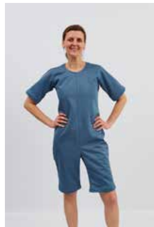
REISSFESTER OVERALL, KURZ NHR-551-Größe Größen S - XL