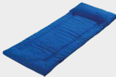
REISSFESTE GEPOLSTERTE UNTERLAGE NHU-730 198 x 71 cm