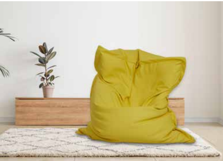
Farbe des Sitzsacks im Bild: Sonne