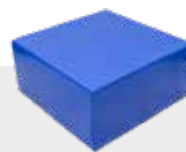
TISCH / SOFAMODUL NH-040 L 80 x B 80 x H 41 cm