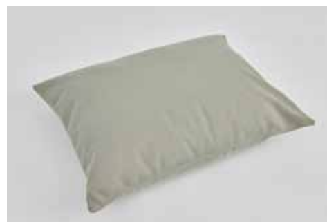
◀ REISSFESTES KOPFKISSEN NHR-520 60 x 70 cm