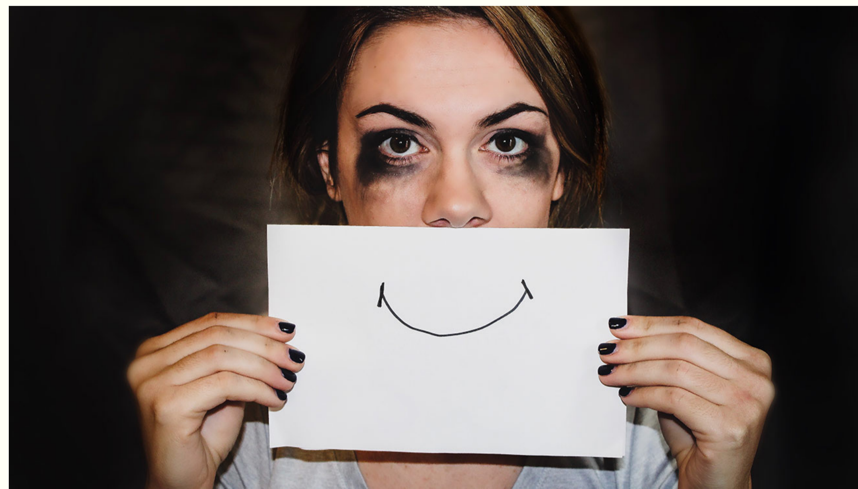
Frauen in den Wechseljahren können nicht nur wieder sie selbst werden, sie können noch besser werden. Und zwar nach ihren eigenen Vorstellungen.

In den Wechseljahren verändern wir uns. Körper und Psyche ticken plötzlich anders. So manche Frau, die bislang als Fels in der Brandung galt, wird nervös und ängstlich. Die gewohnte emotionale Balance weicht mitunter starker Reizbarkeit. Der Körper, den wir seit Jahrzehnten so gut kennen, verhält sich völlig anders, als erwartet. Nicht wenige Frauen haben das Gefühl, nicht mehr sie selbst zu sein.