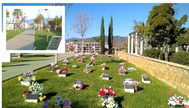
Figura 5. El Bosque de las Cenizas (Cementerio de la Fuensanta).

Más moderno en su diseño. Desde el 2008, el cementerio cuenta con un nuevo espacio, el Bosque de las Cenizas (Fig. 5). Situado en la zona norte del cementerio, ofrece la posibilidad de depositar bajo el árbol elegido las cenizas del difunto en una urna biodegradable que quedará integrada en la propia naturaleza de la tierra en pocos meses. Además, de contar con el Muro del Recuerdo donde se ofrece la posibilidad de inscripción para rendir homenaje a la memoria del fallecido.