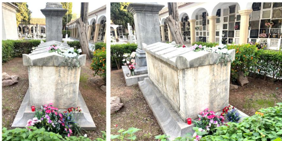
Figura 4. Tumba del pintor Julio Romero de Torres.