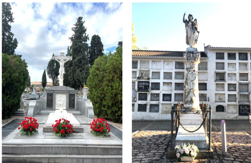
Figura 3. Tumba de Manolete y Lagartijo.

Su interior alberga enterramientos de personas ilustres de la vida cordobesa del S.XIX y XX, siendo lo más populares los pertenecientes a figuras destacadas como los toreros Manolete, Lagartijo o Guerrita (Fig. 3).