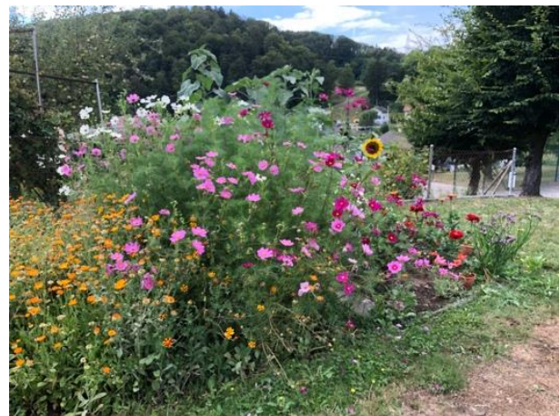
Der Blumengarten in seiner vollen Pracht. Sommer 2021