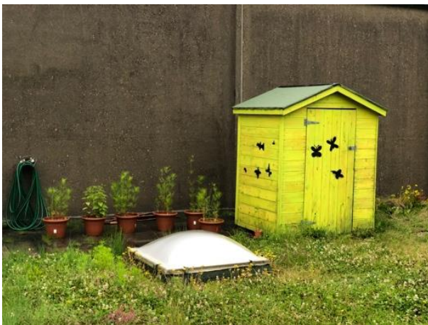
Gartenhäuschen, welches die SchülerInnen zusammenbauten und anmalten.