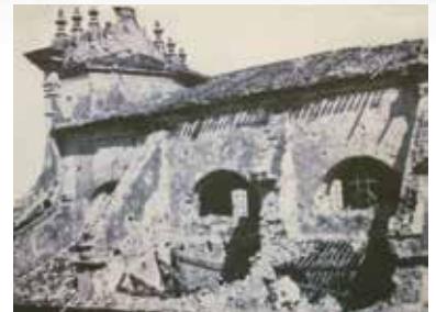
2 - febb. 1944 Basilica S. Barnaba