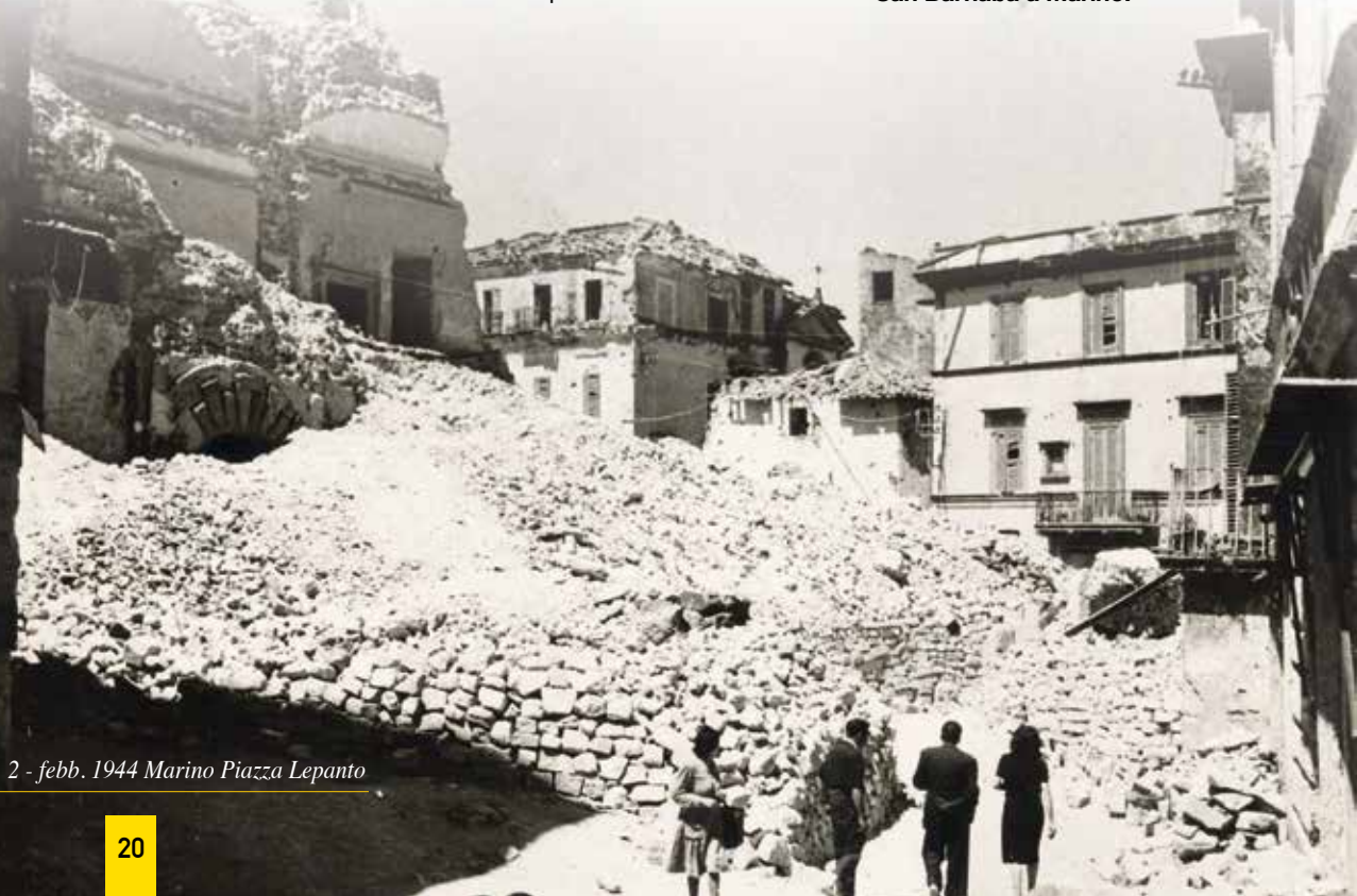
2 - febb. 1944 Marino Piazza Lepanto

zio, una sola granata il 1° giugno 1944 stroncò la vita di 11 persone appena uscite da un rifugio, nei pressi della Chiesa di S. Maria delle Grazie a Borgo Garibaldi. Ai 352 caduti civili nel periodo 1943 - 1944, vanno aggiunti 39 militari morti in combattimento o a seguito di ferite riportate e 39 militari dispersi dal 1940 al 1945. I nomi di questi caduti, civili e militari, sono incisi nelle quattro lapidi poste presso l'altare del Crocifisso e dell'Addolorata nella Basilica di San Barnaba a Marino.