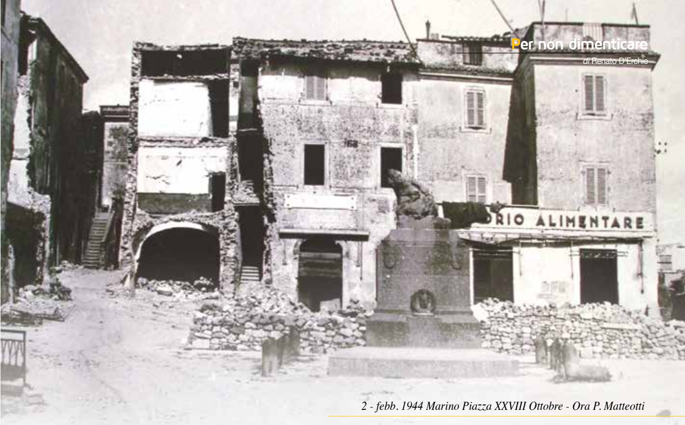
2 - febb. 1944 Marino Piazza XXVIII Ottobre - Ora P. Matteotti

Il monumento che è stato dedicato a tutti i caduti si trova in Piazzale degli Eroi.