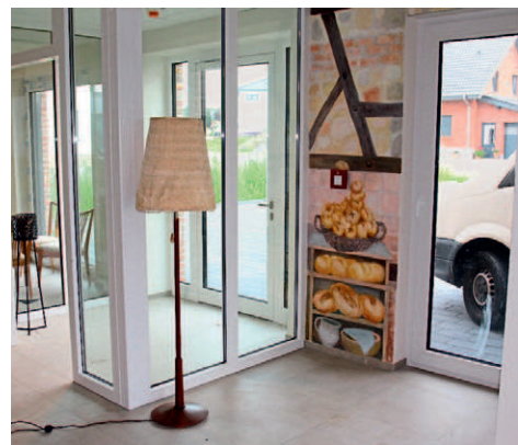
Im Erdgeschoss des „Haus voller Leben“ entsteht das öffentliche Café „Aber bitte mit Sahne“.

Sonntags hat das Café in den Nachmittagsstunden geöffnet. Montags ist Ruhetag.