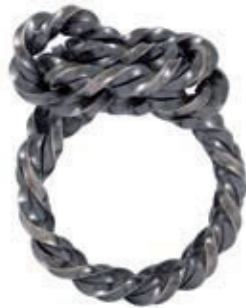
Tania Friedrichs Silber 925, gesiedet