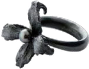
Niki Sardamov Silber 925, Tahiti-Perle [erhältlich bei Tiberius/Wien]