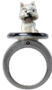
Charlotte Edelstahl, Perlmutter