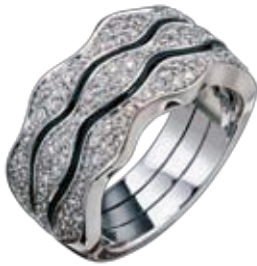
Leo Wittwer Weißgold 750, Diamanten, Kaltemaille