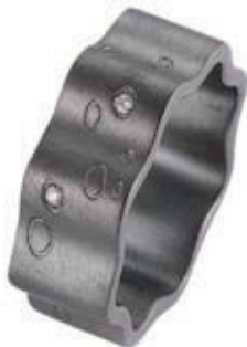
Ring by Ring Silber 925, schwarz rhodiniert, 3 Brillanten