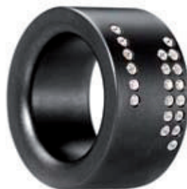
Heidemann Edelstahl, schwarz beschichtet, Swarovski-Schmucksteine