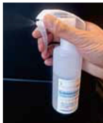
専用スプレーボトル