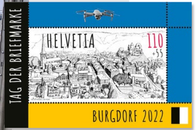
Visualisierung anhand Abbildungen der «Tag der Briefmarke»-Ausstellung vom November 2022 in Burgdorf